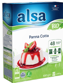
Panna Cotta Bio

Bonne conservation des crèmes au frais : 48 h.