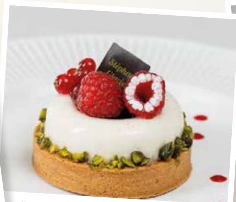
Délice de Bourgogne et à la Vanille Tahitensis