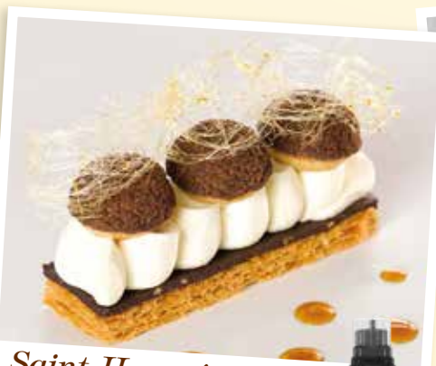
Saint Honoré à la Vanille Bourbon et au Chocolat

Crème pâtissière et crème diplomate à la vanille