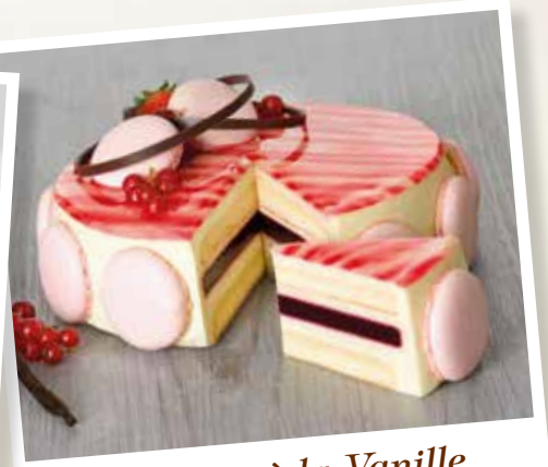
Suprême à la Vanille et aux Fruits Rouges

Crème pâtissière, diplomate, chantilly, punch à la vanille