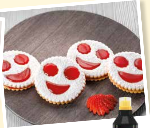
Sablés Smileys Fraise