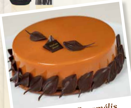
Entremets Caramélisé à la Vanille Tahitensis

Recettes créées par Stéphane Glacier - Meilleur Ouvrier de France 2000