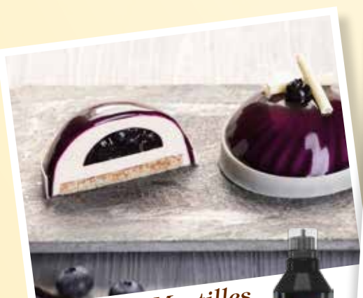
Dômes Myrtilles & Vanille de Madagascar